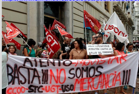
Imagen por José Cuellar

http://www.elmundo.es/sociedad/2017/02/16/58a57365e2704e91578b465f.html