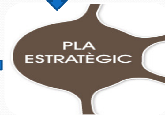
Pla Estratègic de Subvencions CAIB